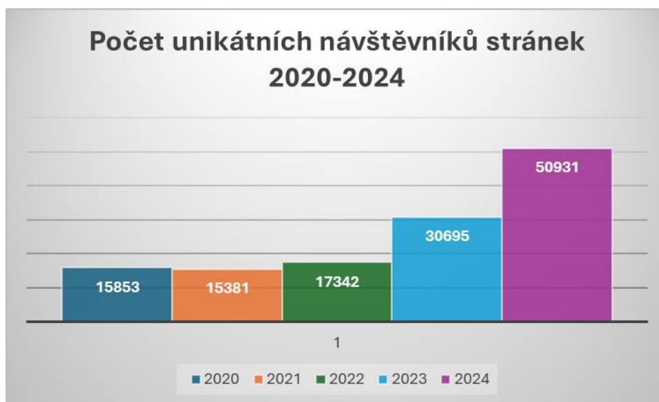
Graf 1: Kontinuální nárůst návštěvníků stránek v průběhu let 2020–2024: přehled počtu unikátních návštěvníků.

Následující dva grafy znázorňují trvalý a kontinuální nárůst návštěvníků i navštívených stránek v průběhu posledních pěti let (2020–2024):