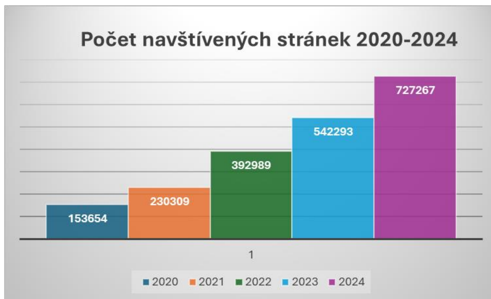
Graf 2: Kontinuální nárůst návštěvníků stránek v průběhu let 2020–2024: přehled počtu navštívených stránek.